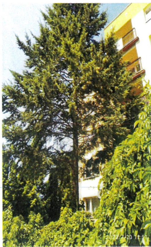
ŚWIERK NR 2

Wycinka jest niezbędna ze względu na planowaną rewitalizację przyległych do budynku terenów zielonych, poprawę walorów jakościowych i estetycznych terenu osiedla.